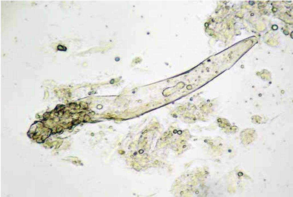
Figura 2. Demodex folliculorum . Montaje en KOH al 40 % (10X)

pestañas. Demodex folliculorum puede alimentarse de las células epiteliales que recubren la unidad pilosebácea o, incluso, de otros microorganismos que habitan el mismo espacio, como P. acnes 7 .